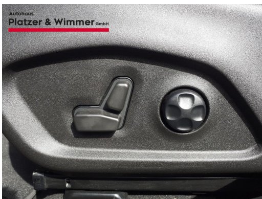
Autohaus Platzer & Wimmer GmbH