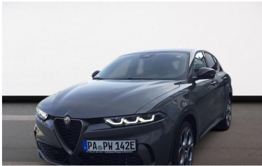
Autohaus Platzer & Wimmer GmbH Tel.: 08505 90 00 0