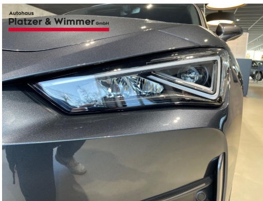
Autohaus Platzer & Wimmer GmbH