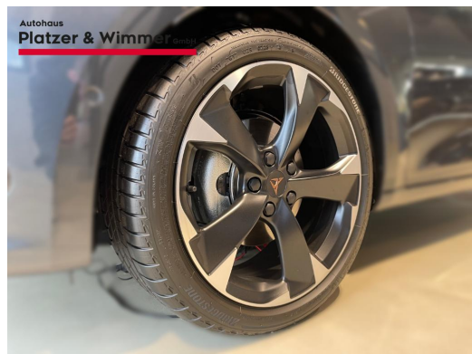
Autohaus Platzer & Wimmer GmbH