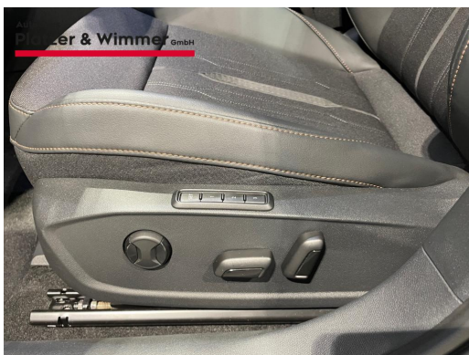
Autohaus Platzer & Wimmer GmbH