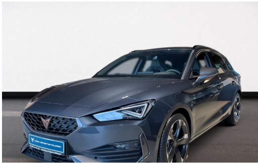
Autohaus Platzer & Wimmer GmbH Tel.: 08505 90 00 0