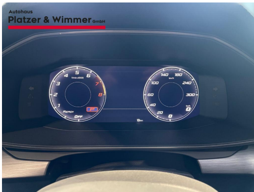
Autohaus Platzer & Wimmer GmbH