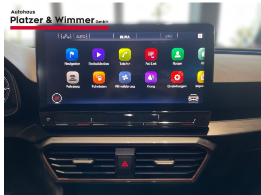
Autohaus Platzer & Wimmer GmbH