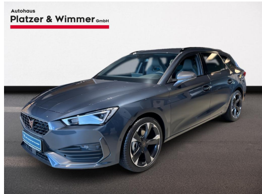
Autohaus Platzer & Wimmer GmbH