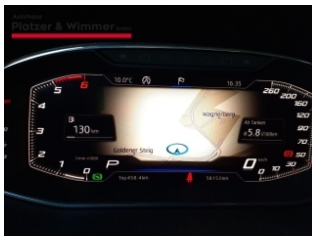
Autohaus Platzer & Wimmer GmbH