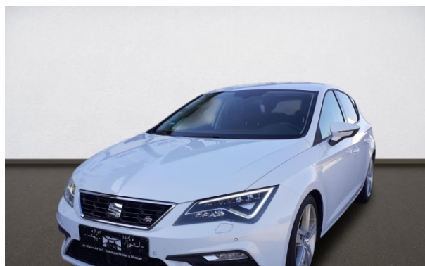
Autohaus Platzer & Wimmer GmbH Tel.: 08505 90 00 0

Barpreis: 20.790 € (MwSt. nicht ausweisbar)