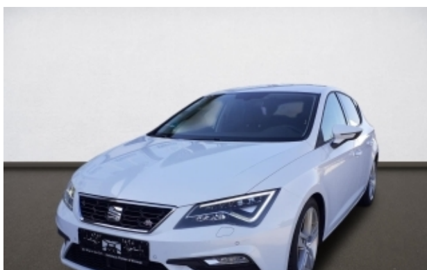
Autohaus Platzer & Wimmer GmbH Tel.: 08505 90 00 0