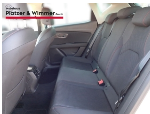
Autohaus Platzer & Wimmer GmbH